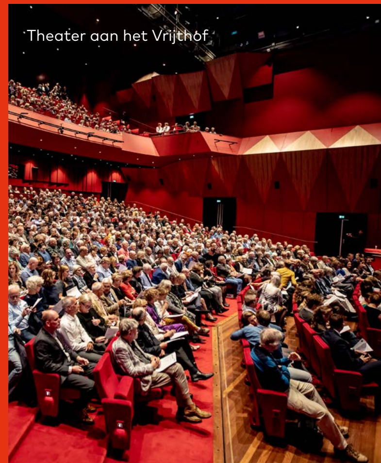
Theater aan het Vrijthof