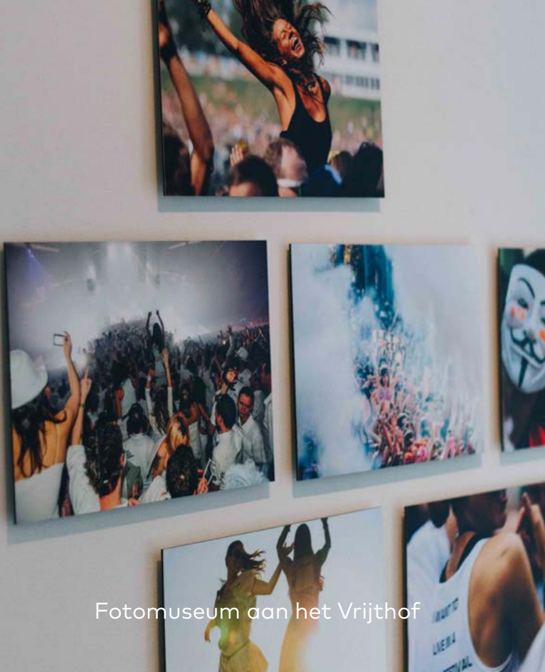
Fotomuseum aan het Vrijthof