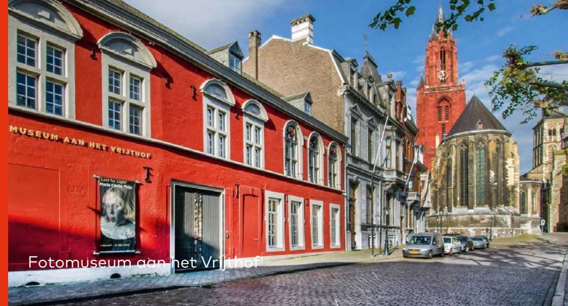
Fotomuseum aan het Vrijthof